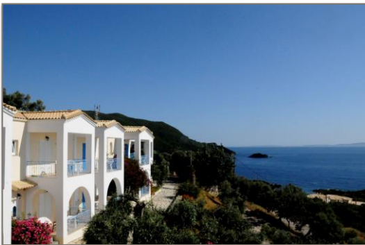
Aus- sicht aus jedem Zim- mer.

Die Region Epirus auf dem griechischen Festland ist ursprünglich und wildromantisch: faszinierende Gebirgszüge mit tiefen Schluchten, die zum Ionischen Meer im Westen hin in liebliche Hügel übergehen.