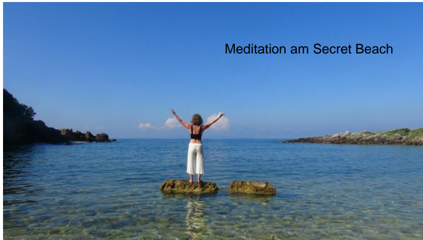
Meditation am Secret Beach